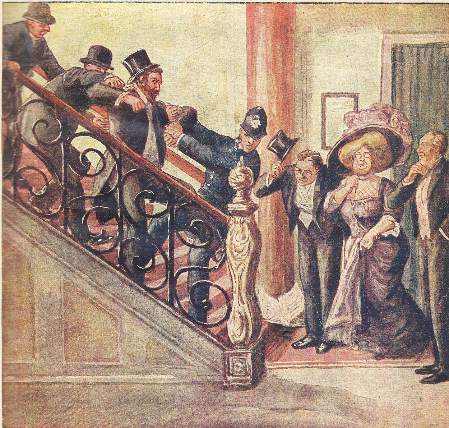
De politie-mannen sleurden den inspecteur de trap af.